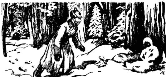
Он заметил под старой ольхой маленького снежного человека. Рисунок Л. СМЕХОВА

Части Красной Армии двинулись на северо-запад, преследуя остатки белофинских бант. Они гнали белых к границе Финляндии, туда, откуда они явились непощенными гостями.