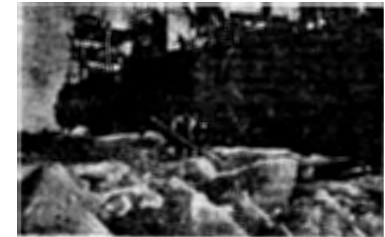
Ледокол «Ермак» во льдах Финского залива. Команда откалывает лед вокруг корабля.