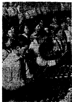
В Сталинском районе Москвы был проведен костер. После него пионеры выступали со своей самостоятельностью. Здесь вы видите группу ребят, играющих на аксиофоне.

К Кировской железной дороге от нашего города проложена ветка длиной в 32 километра. ТОЛЯ ПОПОВ.