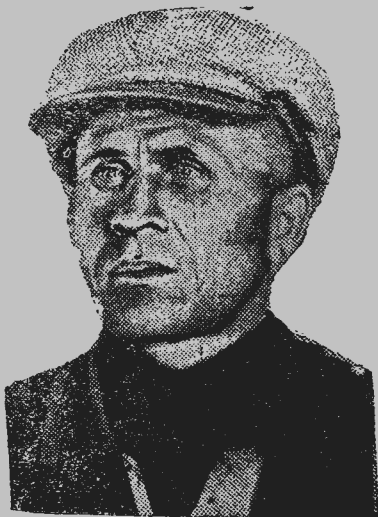
Ударники литейной мастерской